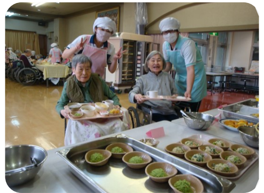
バイキングも人気の行事です