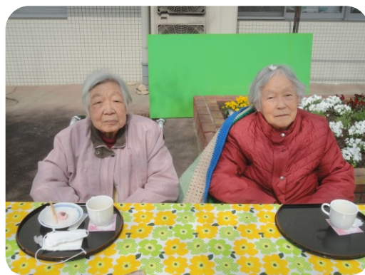
「和菓子も美味しくいただきましたよ」