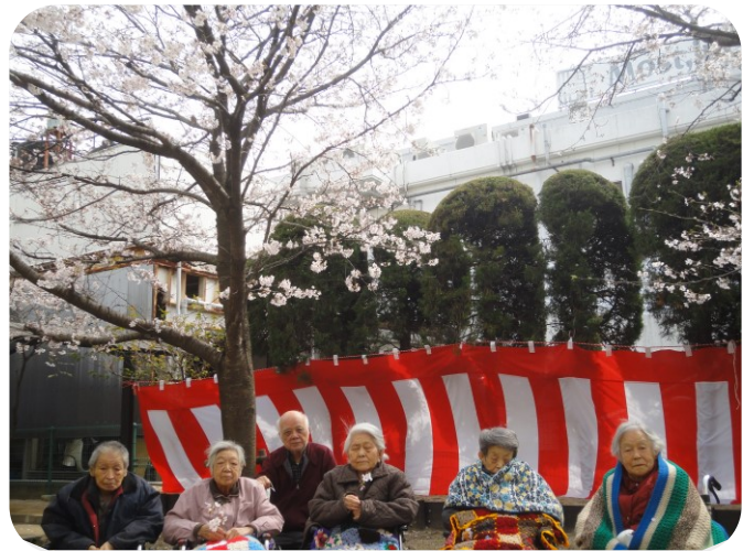
木曜日の皆さん：少し風もありましたが皆さん楽しんでいただきました