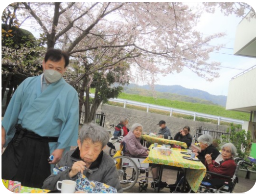
中庭の桜も満開で最高の花見日和でした