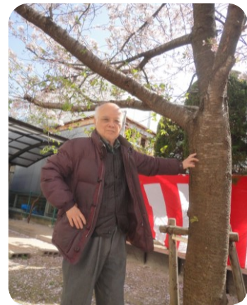
立ち姿がビシッと決まっていますね