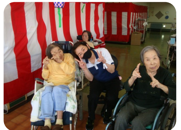
可愛く撮ってね、はいチーズ！

▼テーブルボールというものをご存じでしょうか？名前の通り、専用のカラフルなテーブルで作ったボールです。一見すると、少しペタペタとした感触のボールなのですが、カッターでボールを切ると中から様々な色が出てきます。色が出てくる様子は中毒性がありSNS等で話題になりました。▼私は動画を見て、テーブルボールの存在を知っていたのですが、お店等で専用のテーブルを見つけたことが出来なかったのですが、友達がゲームセンター等で見つけたものを貰い、私も実際に作る事が出来ました。実際に作ってみると、ただテーブルを丸めていくだけなのに、何故だかとてもストレス発散になっていました。時間をかけ何色ものテーブルを巻いているだけでボールに愛着すら湧いてしまいました。▼まだまだ小さなテーブルボールですが、少しずつ時間をかけ大きくしていきたいと思えます。(S・O)