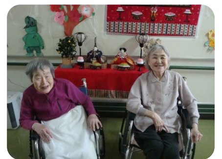
皆さんの素敵な笑顔に職員もホッコリさせて頂きました