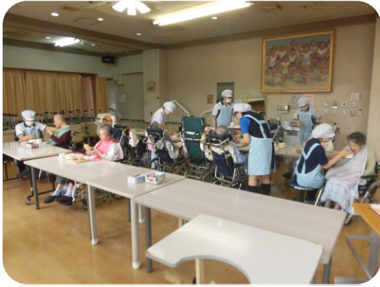
2階の様子：完食される方も多かったです