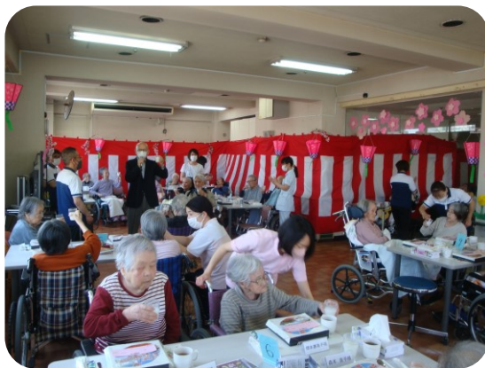
「皆さん一緒に楽しみましょう、カンパ〜イ！」