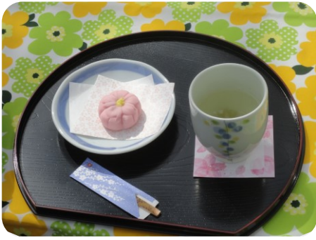
お茶と和菓子をどうぞ！

時折風の吹く日もありましたが、天候に恵まれ、利用者の皆さんはきれいに咲いた桜を見ながらゆっくりと時間を過ごされていました。温かいお茶と花の形の和菓子を食べ、それぞれのテーブルで楽しいおしゃべりと笑顔の花が満開です。桜を背景に記念写真もたくさん撮りました。中には俳優さんのような格好いいポーズを決めてカメラに収まる方も： また来年、皆さんと一緒に元気でのお花見しましょうね。 (T・K)