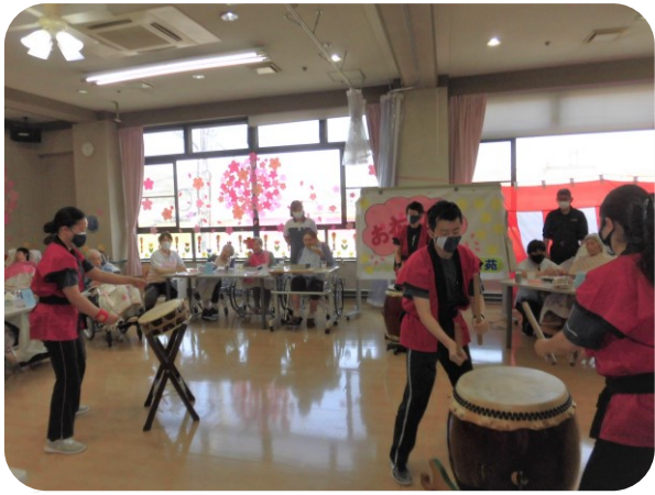
『ゆかり』の太鼓に皆さんくぎ付けでした