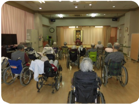
3月15日妙蓮寺の僧侶をお迎えしてお彼岸法要が営まれました