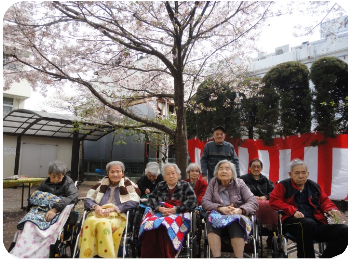
火曜日の皆さん：素敵な笑顔ではいチーズ！