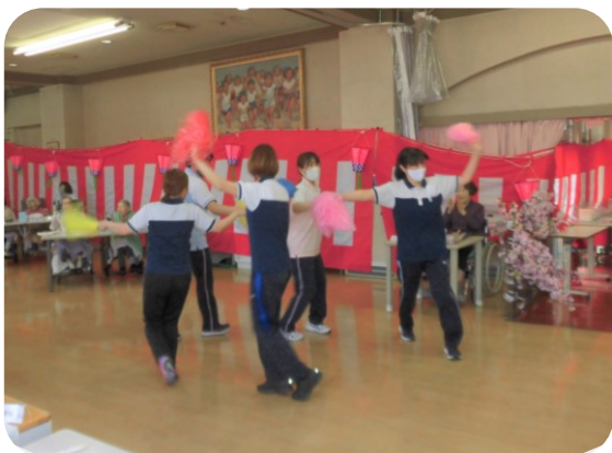
職員も出し物で盛り上げます！

4月1日(土) 特養の花見が行われました。 二階三階のホールには桜やチューリップ、たんぽぽが咲き春の訪れを感じさせました。ゆかりメンバーによる開幕太鼓が鳴り響くと涙をためる利用者もいました。小さな法被の形をしたうちわを振りながら「とつても良かったです。ありがとうございます。」とお礼も言って下さいました。 簡単な春のクイズを出してみんなで考えたりもしました。桜餅の形が、関東と関西では違う事を皆さん知っていましたか。利用者の話を聞くと、昔は近所の公園や、比治山、黄金山、平和公園、広島城で花見をしたと教えてくれました。縮景園でお友達とポットを持って行ってお茶会をされた方もいました。歌の好きな利用者さんはカラオケを歌って下さり会場は盛り上がりました。「北の宿から」「みちづれ」「瀬戸の花嫁」「春がきた」等みんながよく知っている歌だったので一緒に口ずさんでいる方もいました。 来年も美味しいお弁当を食べながらみんなで楽しい花見をしましょうね。(S・M)