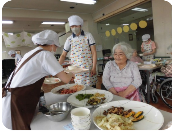
「お肉も柔らかくて食べやすいですよ」