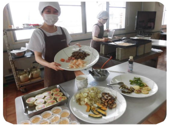
焼きたてをどうぞ〜！