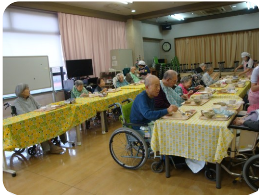
好きな食材を選んで頂きます