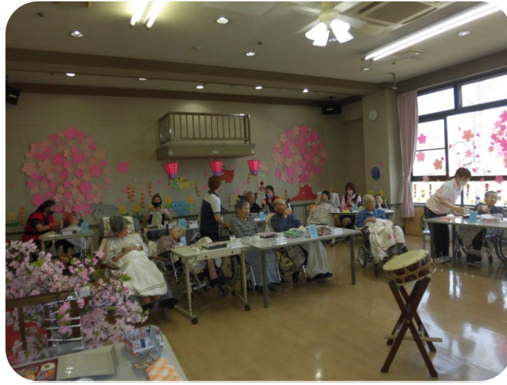
2階3階ともなごやかな雰囲気でした

4月1日(土) 特養の花見が行われました。 二階三階のホールには桜やチューリップ、たんぽぽが咲き春の訪れを感じさせました。ゆかりメンバーによる開幕太鼓が鳴り響くと涙をためる利用者もいました。小さな法被の形をしたうちわを振りながら「とつても良かったです。ありがとうございます。」とお礼も言って下さいました。 簡単な春のクイズを出してみんなで考えたりもしました。桜餅の形が、関東と関西では違う事を皆さん知っていましたか。利用者の話を聞くと、昔は近所の公園や、比治山、黄金山、平和公園、広島城で花見をしたと教えてくれました。縮景園でお友達とポットを持って行ってお茶会をされた方もいました。歌の好きな利用者さんはカラオケを歌って下さり会場は盛り上がりました。「北の宿から」「みちづれ」「瀬戸の花嫁」「春がきた」等みんながよく知っている歌だったので一緒に口ずさんでいる方もいました。 来年も美味しいお弁当を食べながらみんなで楽しい花見をしましょうね。(S・M)