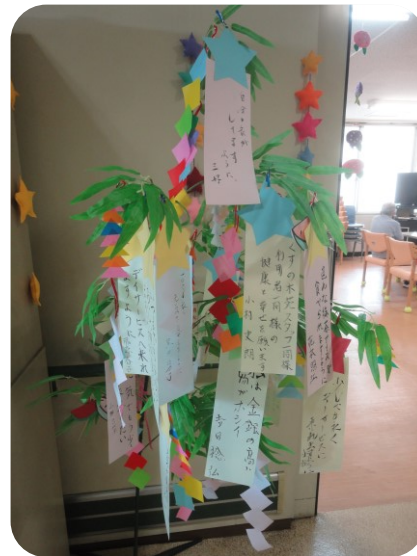
今年も沢山の願い事が飾られました

ました。皆さんの短冊を笹に吊るし、きれいな笹飾りが出来上がりました。皆さんの願い事が叶いますように…。そして、暑い夏が続きますが、みんな元気に乗り越えましょう！ (M・K)