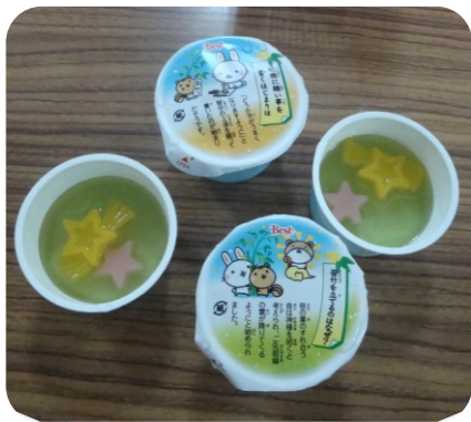
七夕のおやつです。星形のゼリーを頂きました。

7月6日、一日早いですが七夕会が行われました。七夕の壁画に、ご利用者にお願い事を書いてもらった短冊を飾り付け、記念撮影を行いました。【家族の健康】【世界の平和】等、優しさ溢れるお願い事に混じって、【お金が欲しい!】【美人になりたい!】【女房に会いたい!】等、素直な?お願い事もありました。 その後は、みんなで流れ星を模した可愛らしいおやつを頂きました。みなさんのお願い事が叶うといいですね! (K・I)