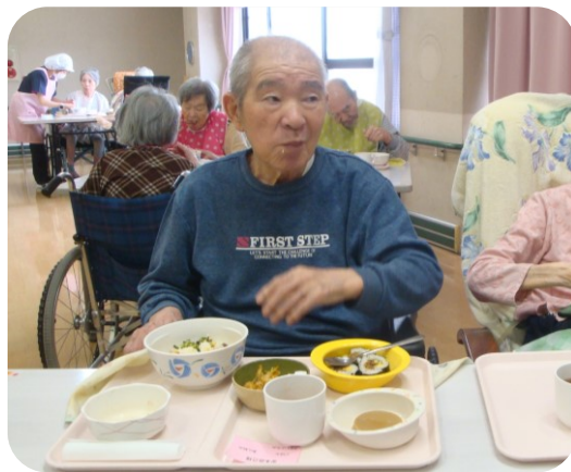
『巻き寿司』や『かき揚げ』もあって大満足！