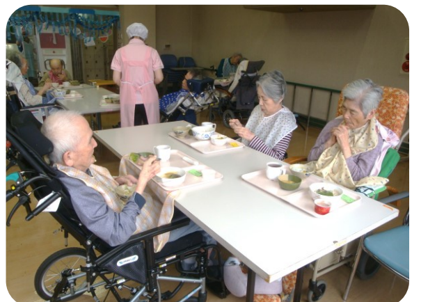
久しぶりのそうめんにご飯を打ちました

▼去年の3月を最後に、実家から犬がいなくなりました。多頭飼いで最後の子が亡くなるまで20年近く、実家では犬を飼っていた。両親は最後の子を見送ってから、祖父母の介護も孫の世話もあるしで、それなりに忙しい毎日を送っていたように見えた。▼でもやっぱり「もう一度犬のいる生活がしたい」と言った。両親は還暦を過ぎたことあって、先のことまで考えてから飼うよう話をし、保護犬にしたらどうかと提案した。「こんな保護施設が可部にあるよ」と紹介すると、すぐ行って見たらしい。1匹のつもりが結局2匹引き取ったと連絡がきた。2週間のトライアルを経て正式譲渡が決まった。10歳と14歳で2匹ともシニア犬だが、とても元気で人懐っこい。更に両親も生き生きとしており、母にいたっては「心のモヤモヤがなくなった」と言う。▼自分も実家に帰るのがとても楽しみになりました。2匹にも2人にも長生きしてほしい。(S・N)