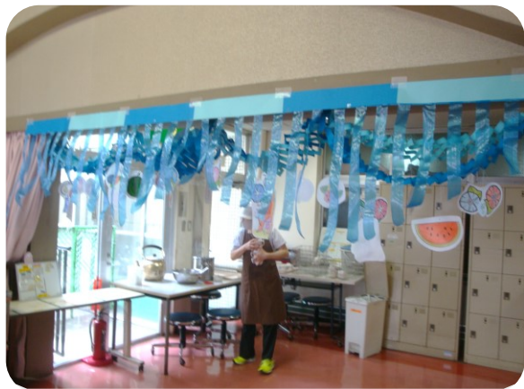
ホールの入り口が涼しげに変身！

6月15日(土)に毎年恒例のそうめんバイキングが行われました。今年も各階、季節にあつた飾りつけも行い、涼しげな雰囲気の中食事を頂きました。みなさん、「涼し気なねえ」と、いつもとは違う雰囲気も喜んでおられました。 そうめんバイキングが始まるとそうめんにかき揚げや卵、味付き椎茸、鶏肉、ナス等色々な具材をのせ「夏はやっぱりそうめんよねえ。」と言いつつ、食の夢中！そうめんをそのまま食べるのが難しい利用者さんには、刻んだりミキサーにしてそうめんの味を楽しんで頂きました。「おかわりちょうだい！」と何度か巻き寿司やそうめんをおかわりされたりと、とても楽しまれておられました。 これからどんどん暑くなってきましたが、しっかりと食べて元気で夏を乗り越えましょうね！ (S・O)