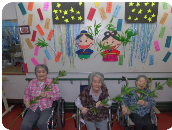
「ささの葉さらさらのきばにゆれる～」自然と歌が出ますね