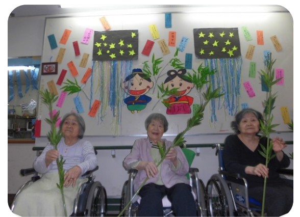
皆さんの願いが叶いますように!