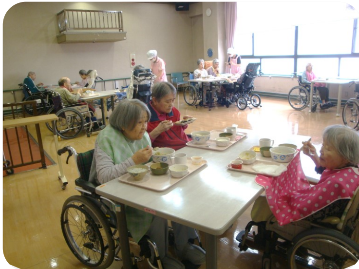
「そうめんにと色々具が乗って美味しいよ」