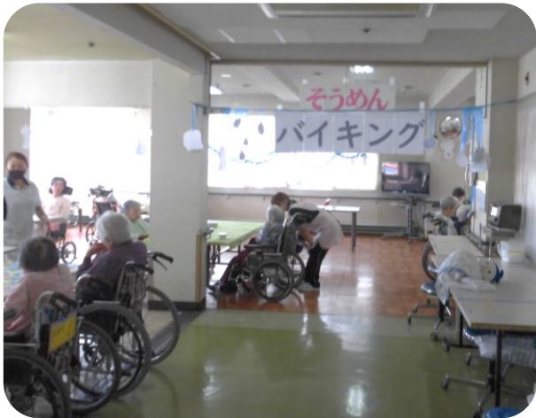
「そうめんバイキングはじめますよ〜！」