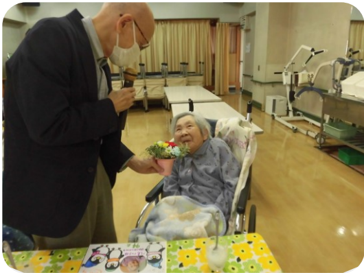
お誕生月のお祝いもさせていただきました

12月28日に令和6年の最後の行事、忘年会を行いました。誕生日会も兼ねており、和気あいあいとした雰囲気でお祝いしました。職員の踊りもあり、みなさん楽しんでおられました。