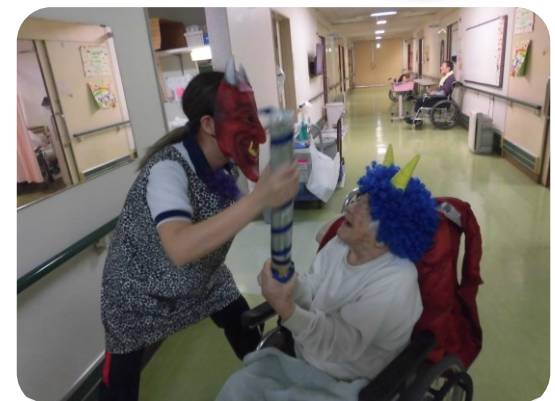
「この金棒は渡さん!」「もうもらった!」

▼4月でくすの木苑に勤め 始めて9年が経ちます。入 社当初は20歳でしたが、今 年で30歳になります。コロ ナ禍で制限されることも多 かったですが、とても楽し く充実した20代を過ごせま した。▼20代のうちにやり 残したことは?と考えたと きに車の免許を取得するこ とだと思い、去年から今年 にかけて約3ヶ月間自動車 学校に通っていました。仕 事をしながら通うことも久 しぶりに勉強をすることも 不安でしたが、学科教習は オンラインでいつでも受講 できるということもあり、 思っていたよりも早く免 許を取得することができま した。▼今のところ自分の 車を買う予定はないので が、ペーパードライバーに ならないことが目標です。 運転をするときは安全運転 を心がけています。30代も 仕事も頑張りつつ、新しい ことにも挑戦して楽しく過 ごしたいです。(S・N)