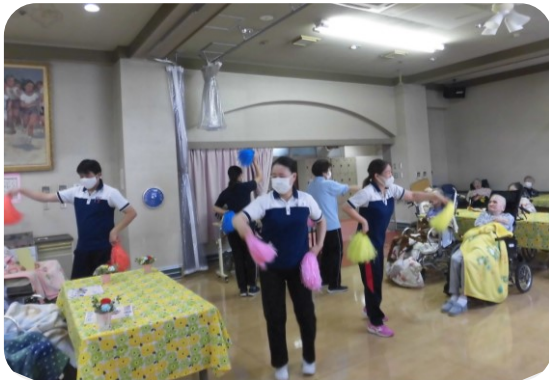
職員も一緒に盛り上げます！