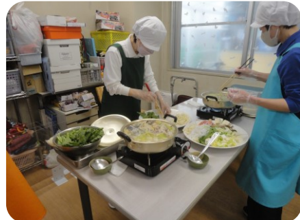
職員が美味しく調理します