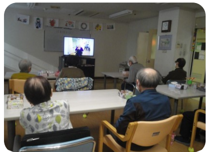
スライドショーで一年を振り返りました