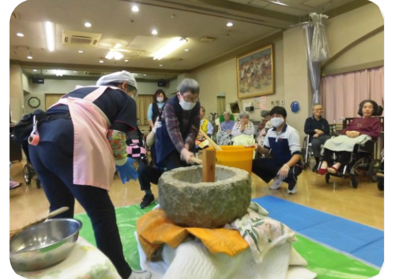
たくさんの方におもちをついていただきました！