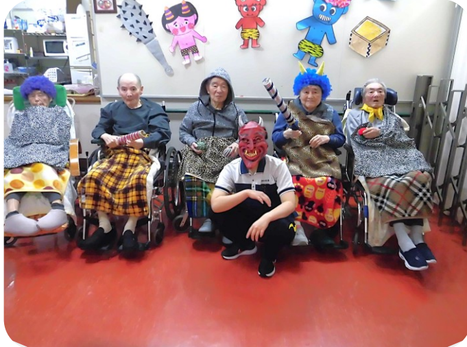
2階での記念撮影、皆さんけっこう楽しんでます!