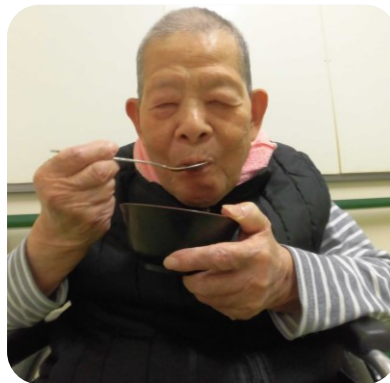
おしるこを堪能「この甘さがええんじゃ～」