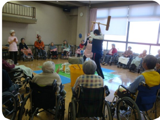
「よいしょ～！よいしょ～！」と掛け声が響きます

12月19日(木)お正月を迎えるための準備として恒例の餅つきを行いました。やっぱり餅つきをすると正月が来るんだなという気持ちになります！ 皆さんが一生懸命ついたお餅はさぞかし美味しいことでしょう。正月用鏡餅の準備は万端、来年も良い年になりますように！ (O・S)