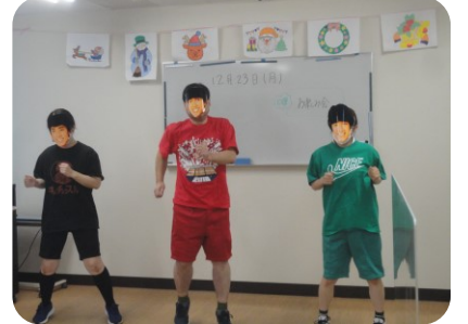
70年代のアイドルが復活歌って踊ってくれました！