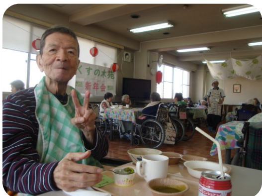
巻きずしやエビフライなどなどお替わりどうぞ！