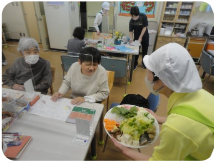
「けっこう具たくさんね！」