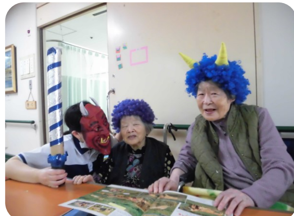
だんだん鬼にも慣れてくるものですね。