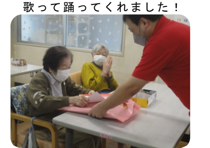
高齢者表彰の様子「これからも元気で越してください」