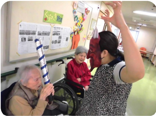
「ガオ〜〜!!」 「おには〜そと!おには〜そと!!」