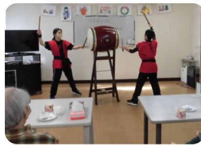
太鼓の音が響き渡ります！