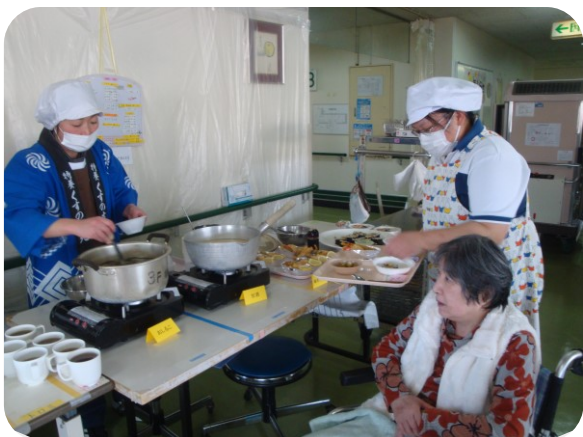
色々なメニューの中から好きな物を選んでいただきます！