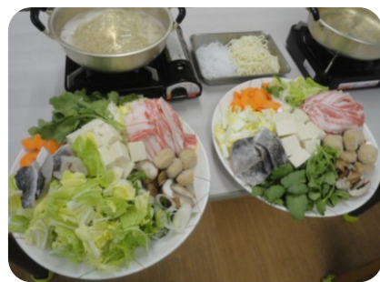
今回の食材がこちら！