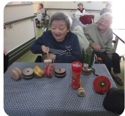
「ダルマ落としはなかなか難しいね～」