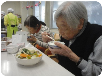
「あ～いい出汁効いてて美味しい！」