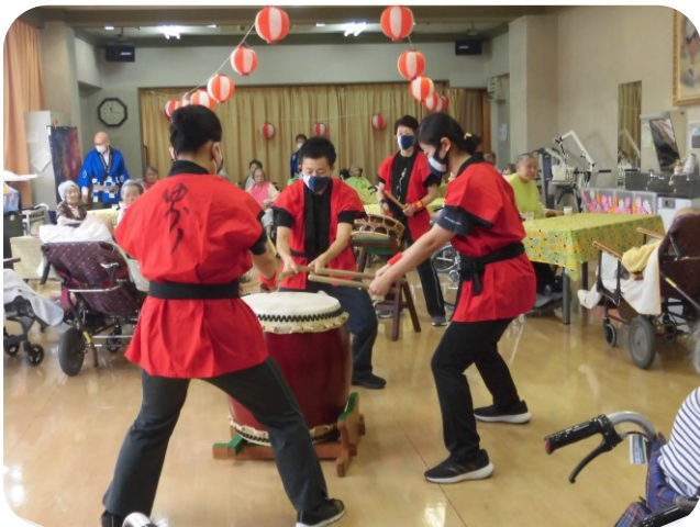
太鼓サークル「縁」力強い演奏です！