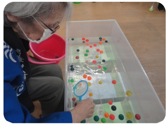
ボールすくいに挑戦、集中力が大事です！