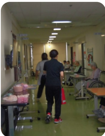
初期消火に向かいます！

11月12日（水）夜間想定で宿直者1名、介護職4名での消防訓練を行いました。 夜間想定のため、限られた職員で行います。しっかり連携を取れるように訓練を行いました。 訓練の最後には水消火器で訓練をしました。今回はデイスサービスの利用者さんも使い方を覚えてたいと参加してくれました。 今後さらに防災意識を全体で高めてたいと思います。 （O・S）