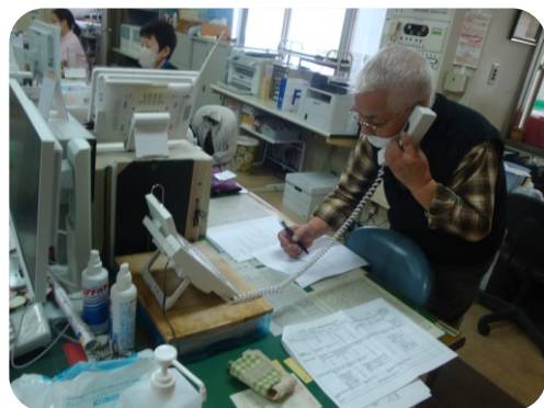
連絡を受け状況を確認！