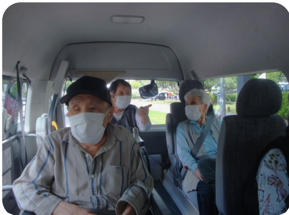
景色を思い出しながら話が尽きません