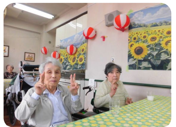
仲良くハイ、チーズ！