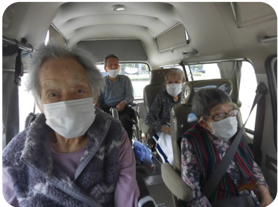
車内から色々な慰霊碑を参拝しました

景色を色々見ているうちに「ここには昔はあの建物があつてね」など記憶をたどりながら色々な話をして下さいました。昔の状況を聞く機会が少なくなっている中、職員にとっても貴重な体験をさせてもらいました。 （O・S）