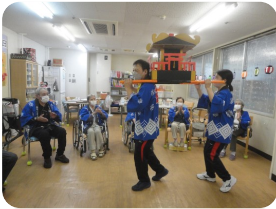
本日のメイン、お神輿の登場！