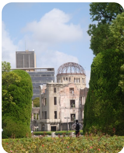
平和への願いが届きますように・・・