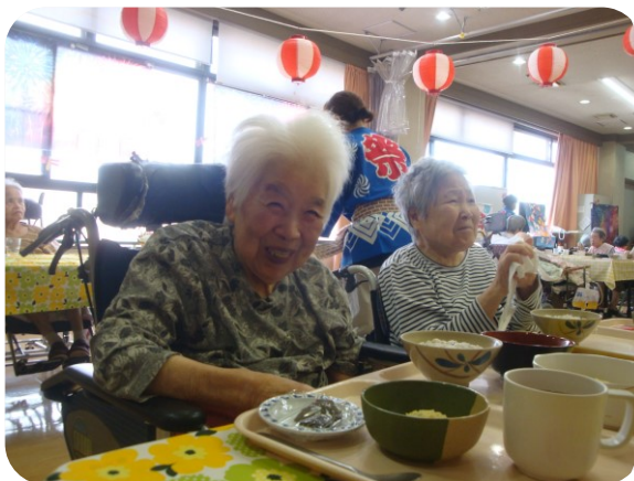
ゆっくり召し上がって下さいね！