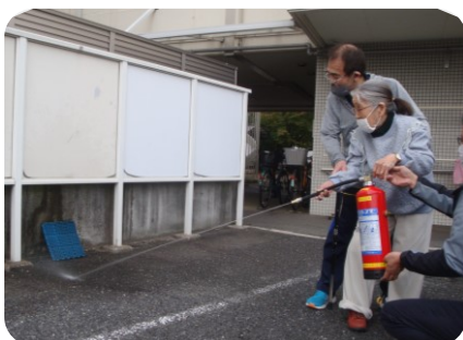
一生懸命消火訓練をされました！