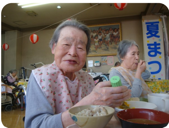
「秋刀魚ご飯がおいしいね！」

残暑も厳しい8月下旬、くすの木苑の特養は感染症が流行り、楽しみにしていた夏祭りは泣く泣く延期となり、少し涼しくなった9月最後の土曜日に誕生日会と合同で行われました。