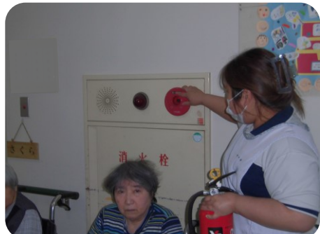
非常ベルを作動、避難誘導開始します