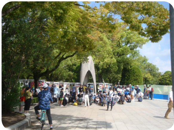
平日ですが、たくさん参拝に来られていました