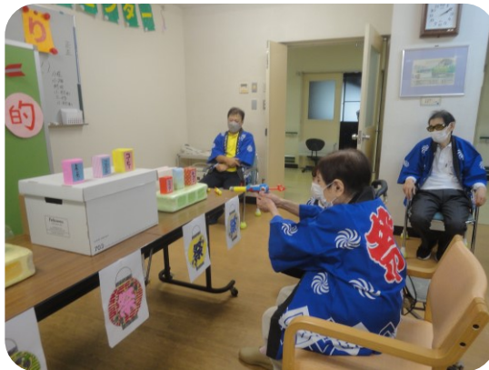
この癖のある銃を使いこなせるかな？