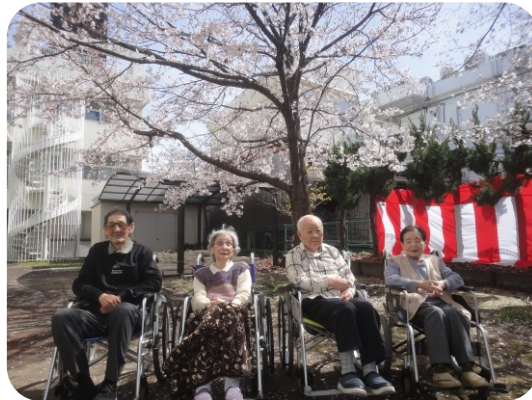
気持ちの良い日とで皆さんリフレッシュされました