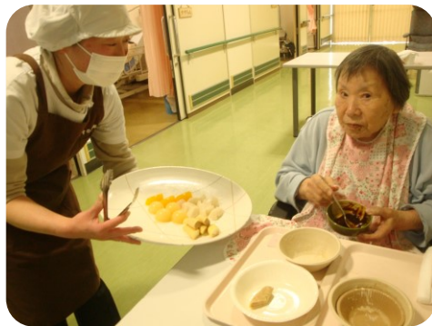
「デザートのおかわりありますよ～」

3月11日2階ホールにて妙蓮寺の僧侶をお迎えしお彼岸法要が営まれました。皆さん静かに手を合わせておられました。