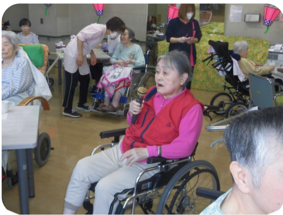
みんなでカラオケ、一緒に盛り上がりました

4月11日(土)昨日は雨が降り、中庭の桜は少し散り始めましたがまだまだ満開です。天気も良く今年も2階と3階に分かれそれぞれでお花見会を行いました。残念ながら今年度は小規模の開催となりましたが、提灯等の飾りつけ等でとても華やかになりました。 くすの木苑有志「縁」による迫力のある太鼓の演奏が始まり、手拍子をとられる方、身体を動かしたりリズムを取られる方、感動をされている方もおられとても楽しまれています。 苑長の乾杯が始まり、待ちに待ったお花見弁当。ご馳走を笑顔で美味しい美味しいと食べられていました。その後、特養職員の吟詠を聴かれ、また歌を歌われる方もおられ笑顔の絶えないお花見会になりました。 来年のお花見会は盛大に開催されることを楽しみに、この1年健康で元気で楽しく過ごしていきたいですね。 (T・M)