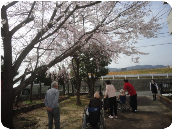
奥の桜がしだれ桜、手前がソメイヨシノです