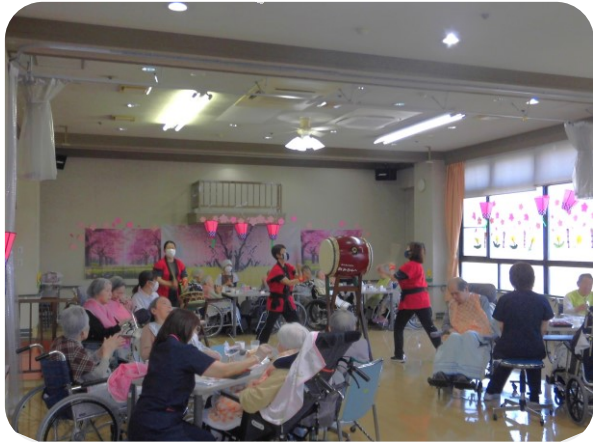
2階の様子、軽快な太鼓の音が響きました