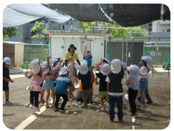
ダンシング玉入れ、曲が止まったら一斉にスタート！