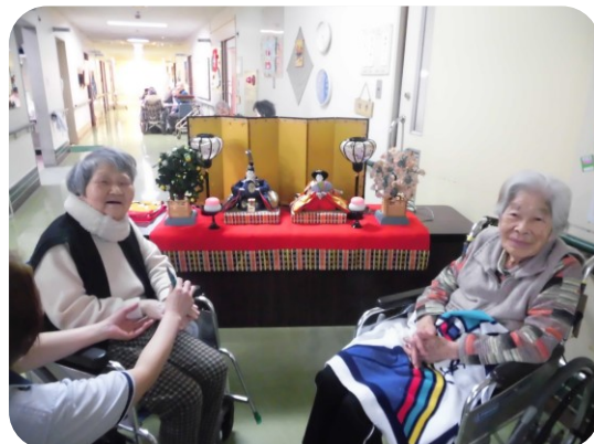
これからも心穏やかに過ごされますように

3月7日(土)ひなまつりを行いました。皆さん雛人形をめでたり、おやつを召し上がったりと楽しく過ごしておられました。