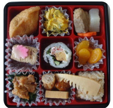
今回のお花見弁当はこちら！