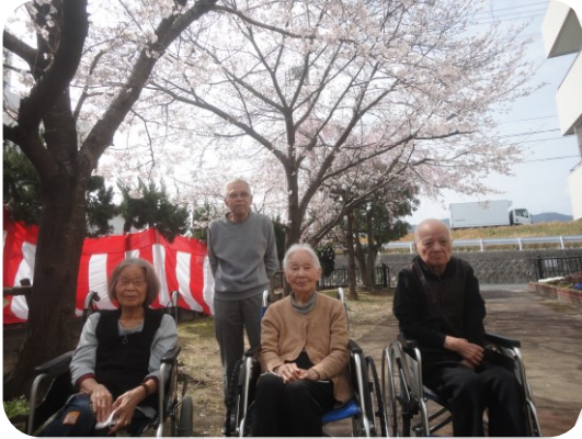
今年も綺麗に咲いてくれましたね！