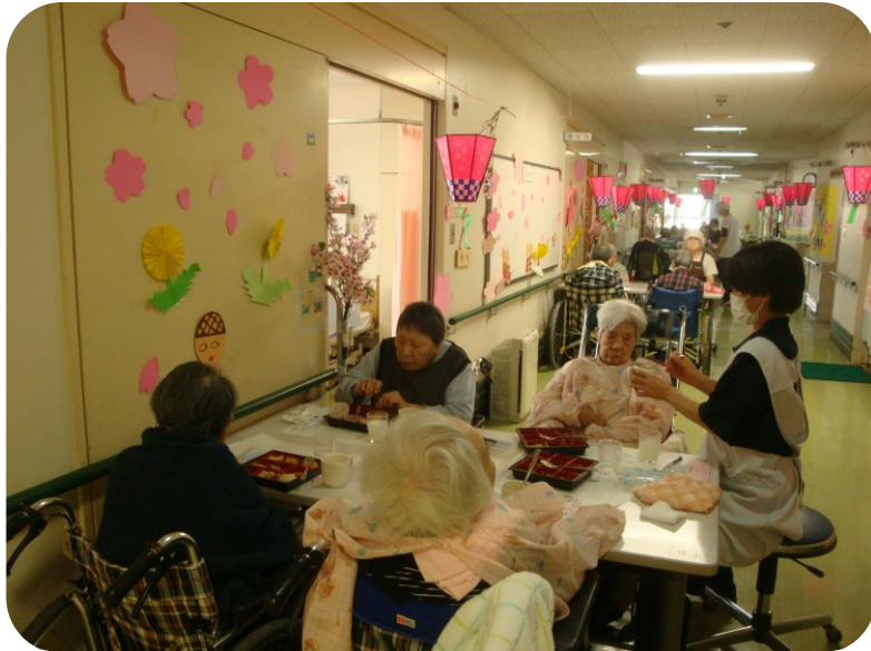
3階の飾り付けも華やかでした