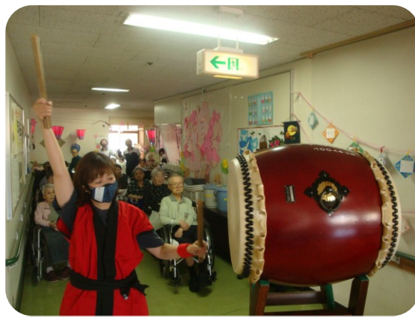
3階での太鼓「小木まつり」