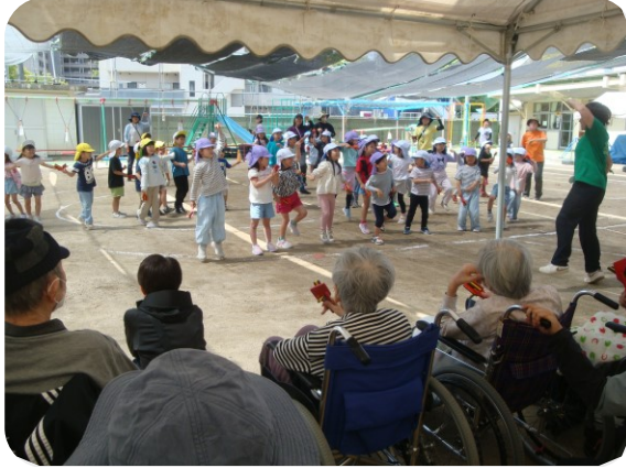
鳴子を使ったダンス「天まで駆けるよ」