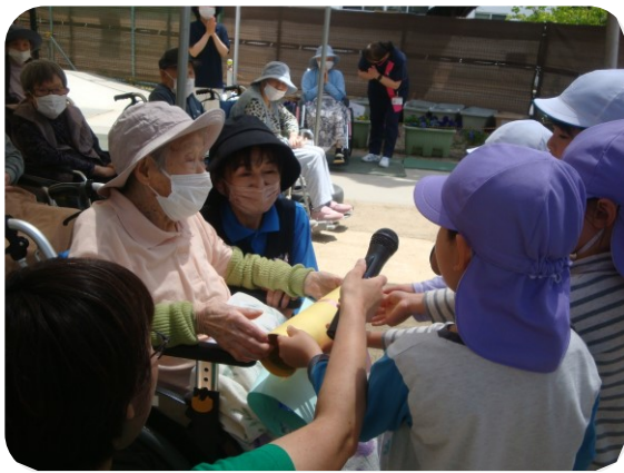
園児さんからプレゼントの贈呈です！