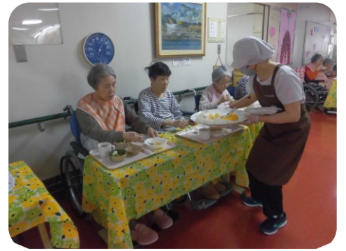
常食、きざみ、ミキサー食と食事形態に対応し楽しんでもらってます