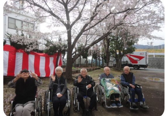
前日は雨でしたが、まだまだ満開！